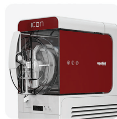
grafiche per versione no visual (OPT) graphics for no visual version (OPT)