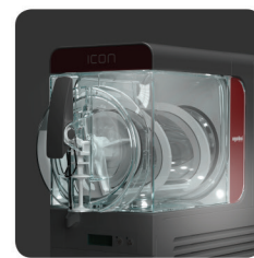
luce frontale - tecnologia LED - (OPT) front light - LED technology - (OPT)