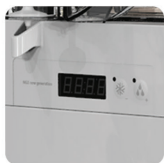
controllo elettronico della temperatura electronic temperature display