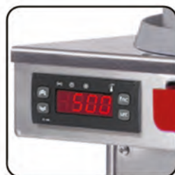
termostato elettronico / electronic thermostat